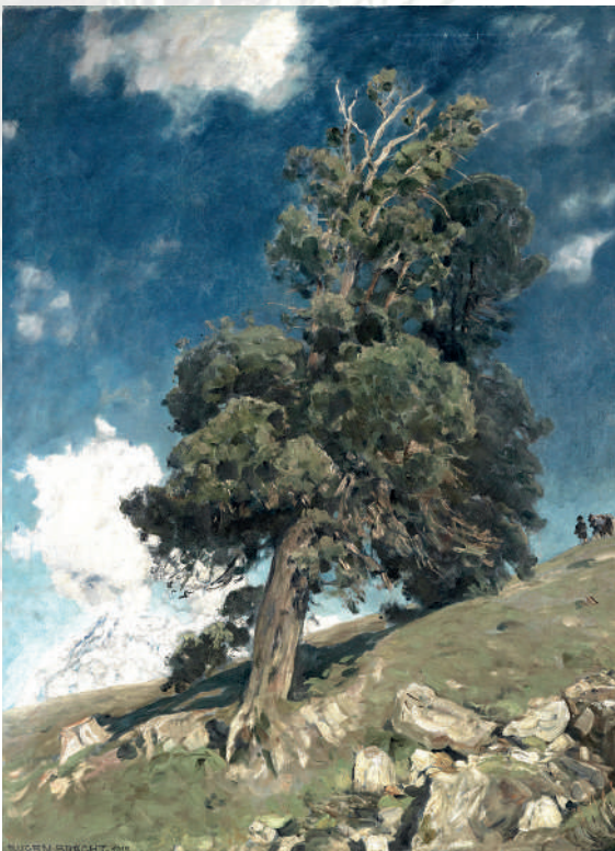
Le pin cembro et le Monte Rosa. Tableau d'Eugen Bracht (1919).

Le casse-noix moucheté ( Nucifraga caryocatactes ) est un corvidé forestier qui niche dans les forêts de conifères de l'étage subalpin, entre 1500 et 2300 mètres d'altitude. Dans les Alpes du Sud, il affectionne tout particulièrement les forêts de mélèzes et d'arolles, qui lui fournissent le gîte et le couvert. L'été, il se nourrit principalement de graines d'arolle, qu'il va chercher en décortiquant les cônes directement sur l'arbre pour en extraire l'amande dont il nourrit ses oisillons. À mesure que l'été avance, les téguments des graines durcissent dans le cône. Les jeunes sont prêts pour l'envol, il est temps de songer à faire des provisions. L'oiseau fait tomber les cônes à terre et les décortique à grands coups de bec. Les graines, au tégument bien dur, disparaissent dans son jabot et seront dispersées dans tout son territoire à raison de dix à trente par cachette. En hiver et jusqu'au retour du printemps, vers le mois de mai, l'oiseau va en effet se nourrir exclusivement des graines qu'il aura cachées dans le sol pendant l'automne et qu'il peut retrouver avec une précision étonnante, même sous une épaisse couche de neige. Il est si efficace dans sa récolte qu'il n'a pas tardé à être accusé de menacer la survie de l'arolle, chassé et classé comme nuisible.