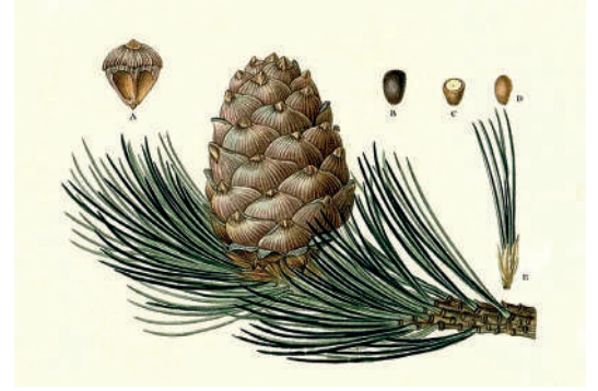
Rameau et cône de pin cembro. Dessin extrait du Traité des arbres et arbustes (2 e éd., vol. 5, 1812) d'Henri-Louis Duhamel du Monceau.

faut plus de deux ans pour arriver à maturité. Mais, une fois mûrs, curieusement, ils ne libèrent pas leurs graines. Alors que d'autres pins ont confié au vent la dissémination de leurs précieuses semences, très nombreuses, petites, légères et dotées d'une ailette favorisant leur dispersion, les graines de