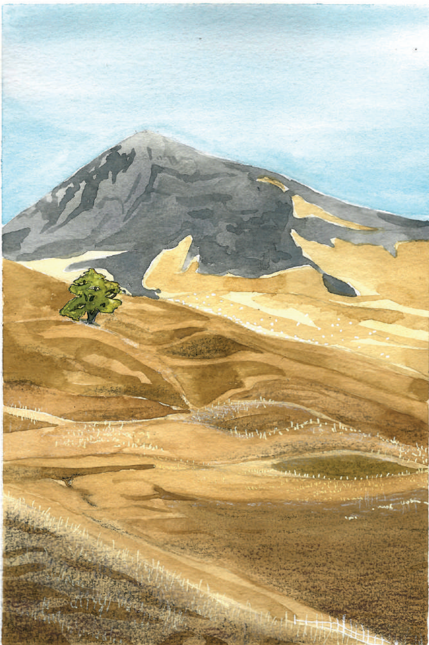
Automne. L'herbe a viré au jaune à cause du pâturage et des gelées mais le mélèze sentinelle rechigne à quitter l'été.

vous. Le mélèze a un feuillage léger, qui laisse passer la lumière et tombe à l'automne. La neige et la lumière pénètrent abondamment dans le sous-bois et favorisent le développement d'une couverture herbacée que le berger fait pâturer à l'automne, quand la neige recouvre déjà les sommets. Les forêts de mélèzes, ou mélézins, constituent des pâturages de début et de fin de saison très appréciables et ont donc été épargnées. Doté d'une écorce très épaisse, le mélèze a également mieux résisté aux feux pastoraux que l'arolle, dont l'écorce est beaucoup plus mince. Les forêts composées de mélèzes et d'arolles, qui occupaient les altitudes comprises entre 2000 et 3000 m à la sortie de la glaciation, se sont donc progressivement transformées, sur les versants exposés au sud, en pâturages d'altitude au-delà de 2400 m et prairies de fauche à proximité des hameaux, et, sur les versants exposés au nord, en forêts claires, pâturées et exploitées pour la ressource en bois. Le pin cembro, dont le bois était recherché pour la confection des meubles et autres objets du quotidien, a fait l'objet d'une exploitation intense. Ce paysage est devenu inhospitalier pour le casse-noix moucheté, qui a besoin d'un couvert forestier beaucoup plus dense pour sa nidification et surtout de la présence d'arolles pour sa nourriture. Longtemps chassé, l'oiseau a donc disparu de ces vallées, probablement dès le Moyen Âge. Plus d'arolles, plus de casse-noix moucheté, plus de dispersion des graines.