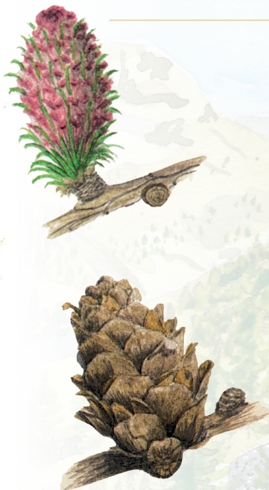
Mélèze d'Europe, Larix decidua . Aiguilles (page de gauche), silhouette, fleur femelle et cône. Dessins de C. Giordano (EUFORGEN, sous licence CC-BY-SY-4.0).