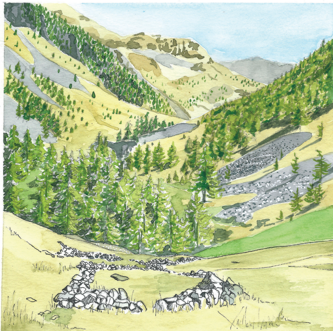
La forêt gagne de tous côtés.